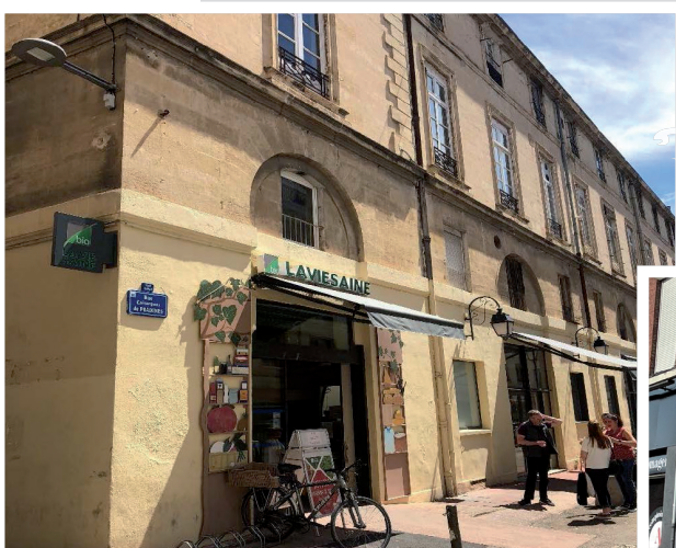
La Vie Saine, Montpellier