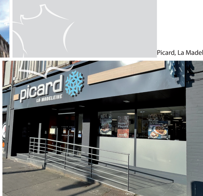
Picard, La Madeleine - Lille

Les photographies concernent des investissements déjà réalisés, à titre d'exemples, mais ne constituent aucun engagement quant aux futures acquisitions de la SCPI. Les actifs ne sont pas nécessairement représentatifs du patrimoine du fonds.